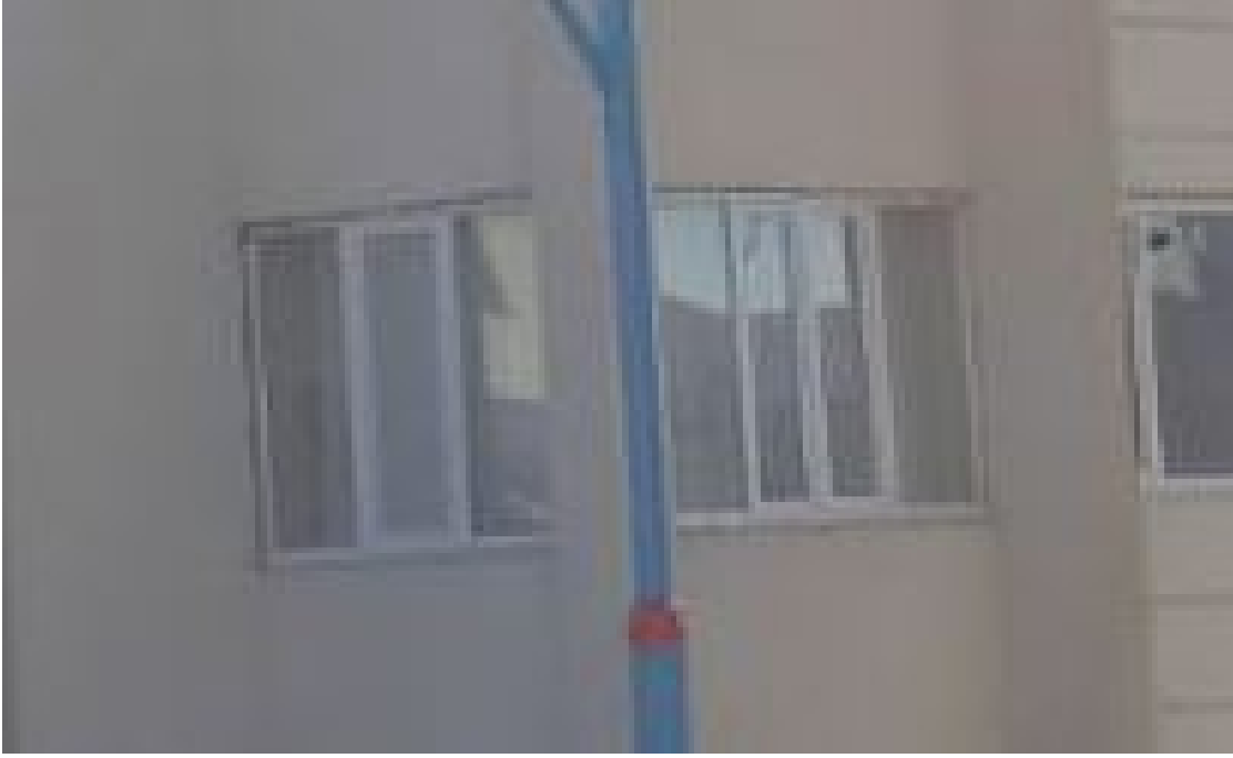
3+1 MUTFAK BALKONU