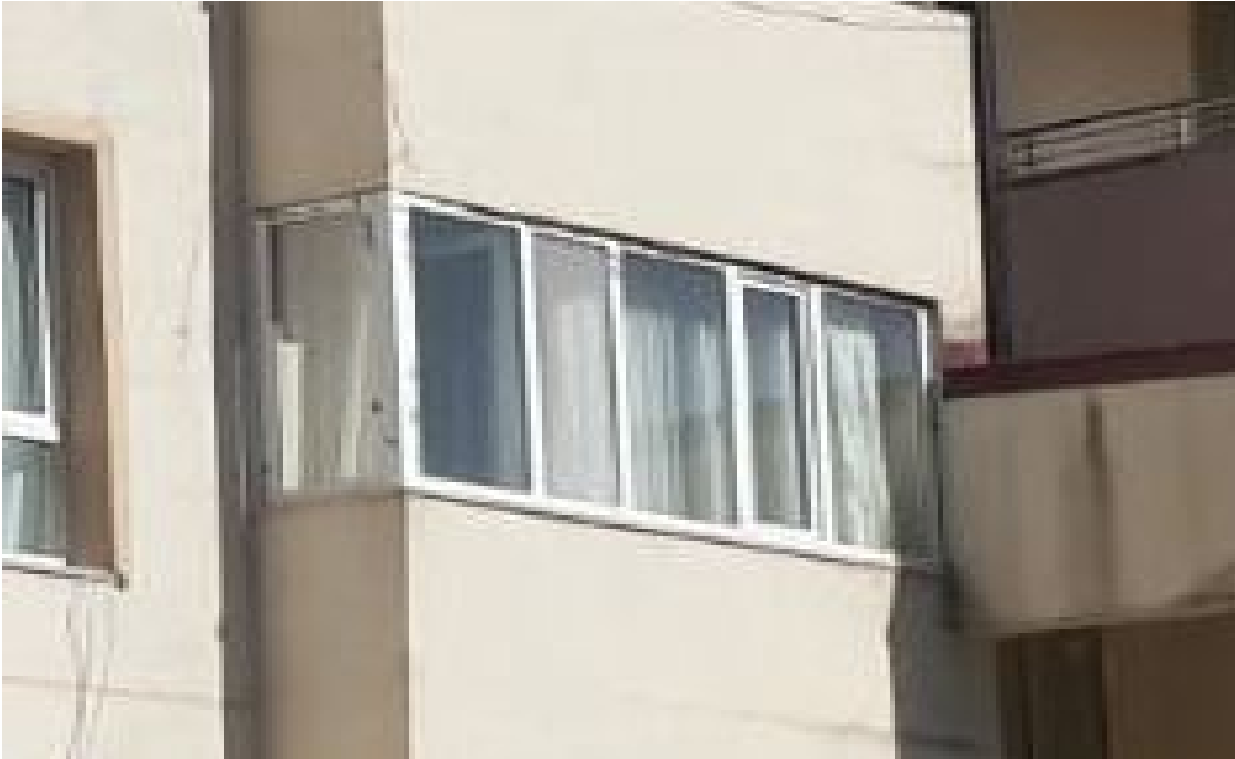
3+1 ODA BALKONU